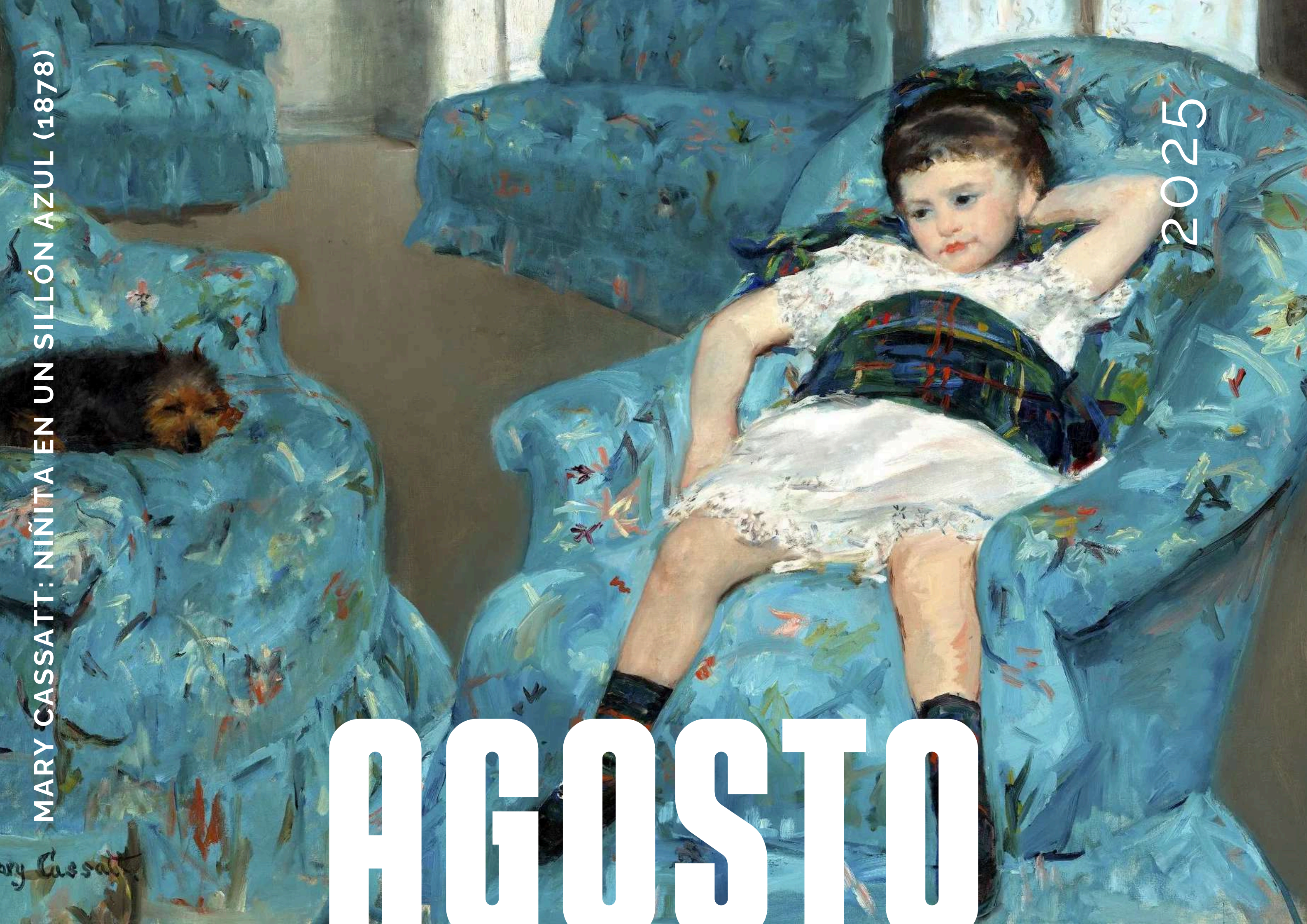
MARY CASSATT: NINITA EN UN SILLÓN AZUL (1878)