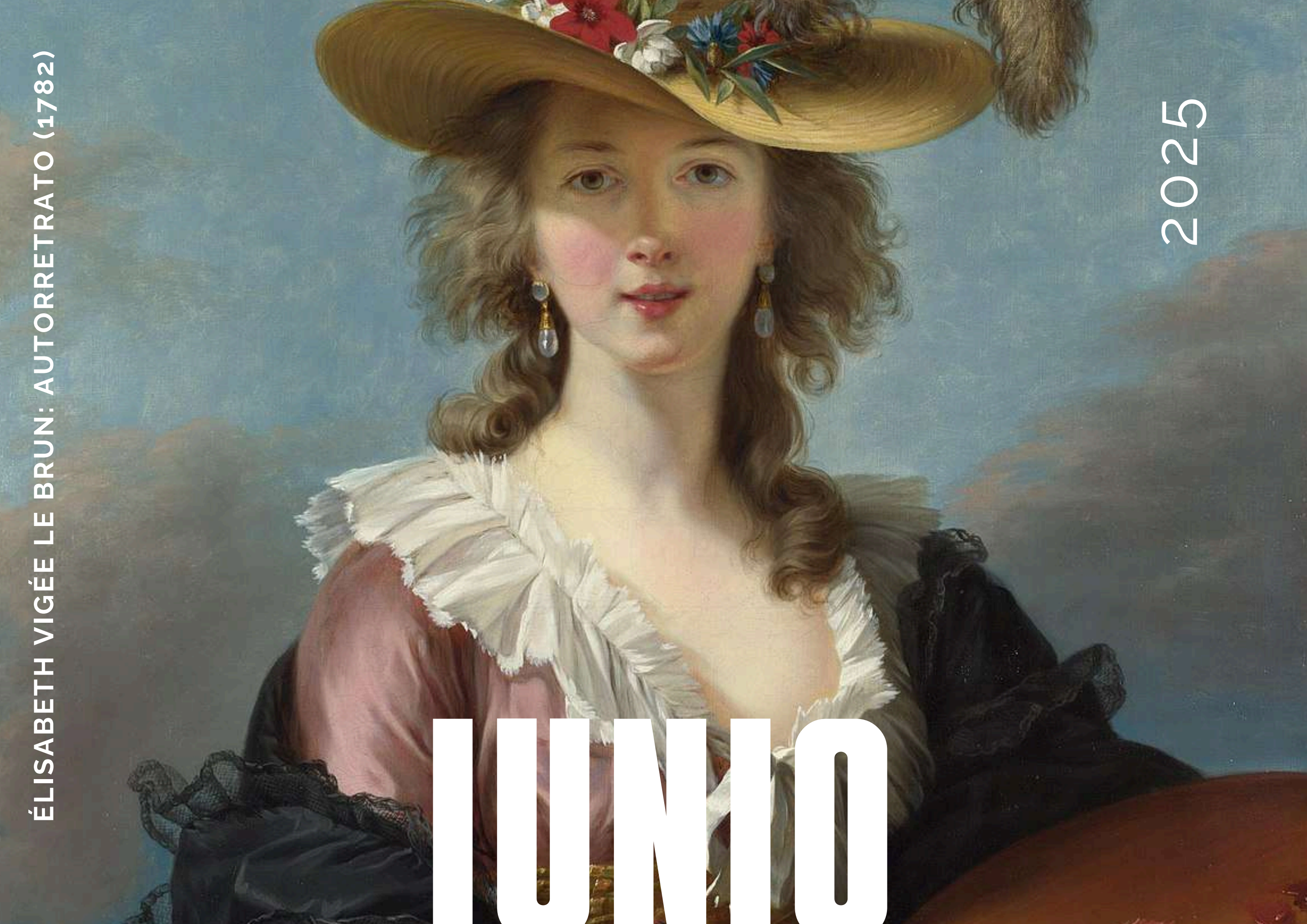
ÉLISABETH VIGÉE LE BRUN: AUTORRETRATO (1782)