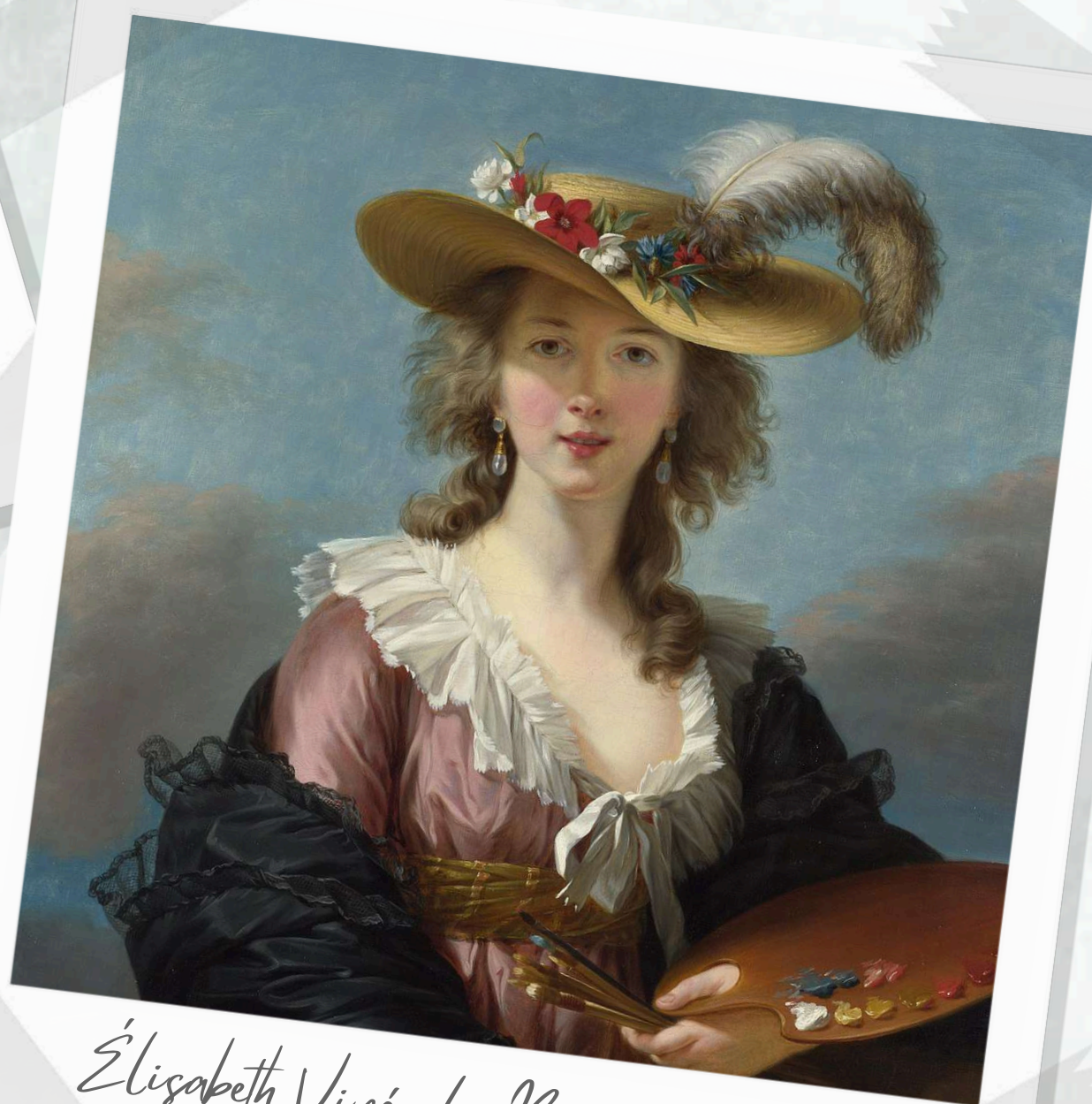
Élisabeth Vigée Le Brun